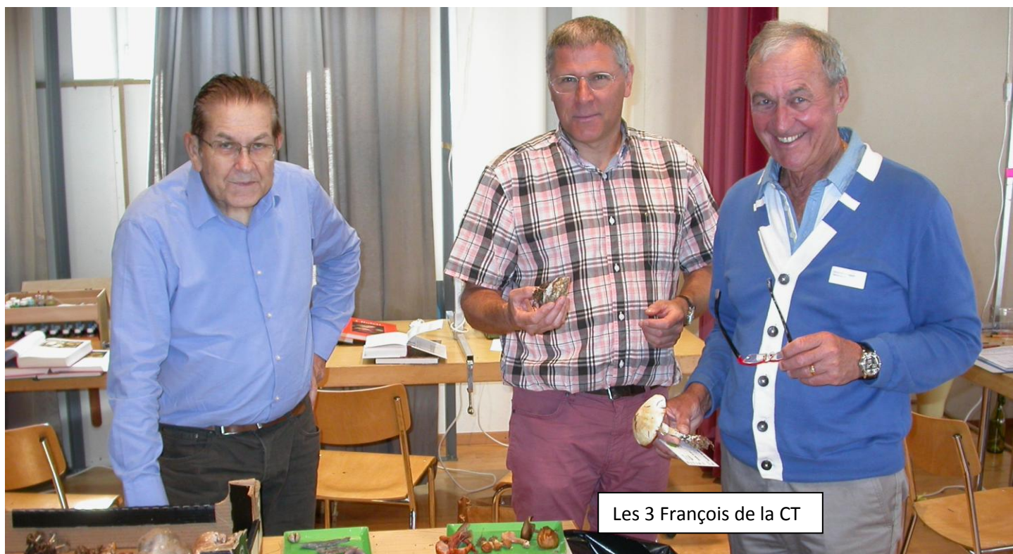
Les 3 Français de la CT