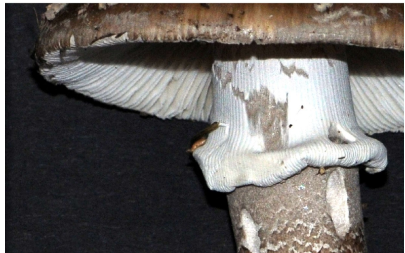
Amanita excelsa, var. spissa : noter l'anneau strié, l'absence de stries sur la marge du chapeau, le pied chiné.